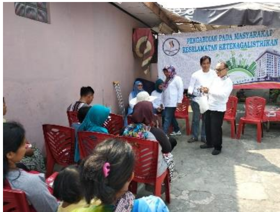
Gambar 2. Pelaksanaan P2M Sosialisasi Bahaya dan Keselamatan Penggunaan Listrik